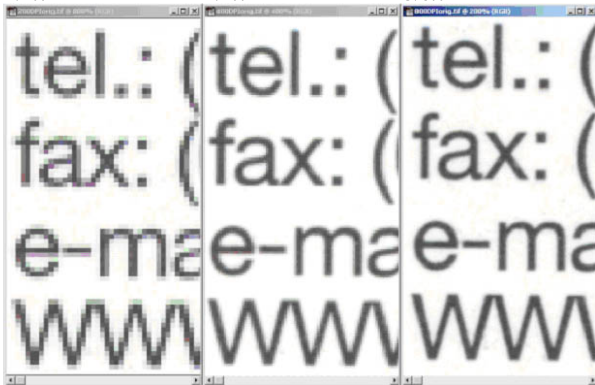
C: 800 DPI

Zdá se, že o evidentních rozdílech v úrovni informačního obsahu netřeba diskutovat. Viditelné pixely zdánlivě jasně ukazují rozdíl kvality obrazů. To, že obraz C je čtyřikrát větší než B je zdánlivě pochopitelné a oprávněné.